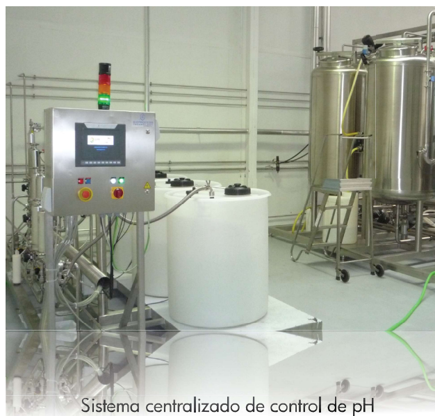
Sistema centralizado de control de pH